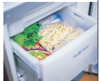
Die Big'n'Freeze Gefrierfach-Schublade nimmt es auch mit sperrigem Gefriergut auf.