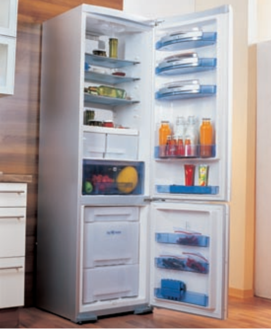
Die neuen Geräte verfügen über eine Vielzahl intelligenter Details der Innenausstattung.

Urlaubschaltung zum Energiesparen. Weitere Steuerungsmöglichkeiten heißen „Super Cool“, „Super Frost“.