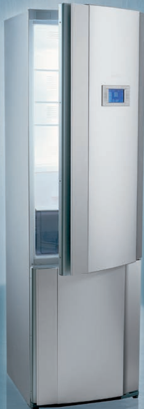
Classic, Exclusiv und Premium heißen die Ausstattungslinien der neuen Kühl- und Gefriergeräte von Gorenje.

Darüber hinaus können bis zu sechs Sprachnachrichten gespeichert werden. Und das mit jeweils bis zu 40 Sekunden Dauer. Hinzu kommen Tipps zur Aufbewahrung von Lebensmitteln aus einer Datenbank, eine Rezeptliste mit Kalorienwert-Angaben, der so genannte ECO-Mode mit automatischer Einstellung optimaler Temperaturen im Kühl- und Gefrierteil sowie die Go'n'Safe Funktion als