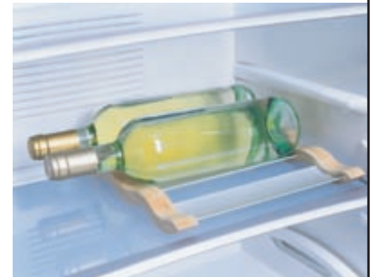
Das elegante Flaschenregal macht auch auf dem Tisch eine gute Figur. Im Kühlschrank sorgt es für Stabilität – für zwei große oder drei normale Flaschen.