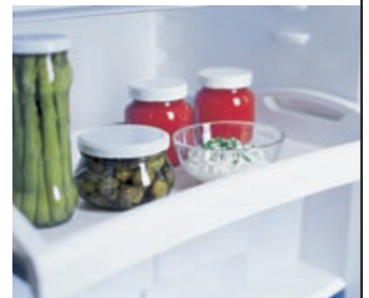
In'n'Out: Das Ablagebord auf Teleskopschienen eignet sich hervorragend für häufig verwendete Lebensmittel des täglichen Bedarfs.