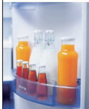
Zweireihige Tür-Ablagen für mehr Innenraum-Komfort.