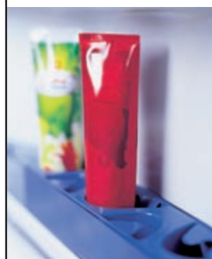
Die Suche nach der passenden Tube gehört nun der Vergangenheit an. Ein spezieller Halter sorgt für Übersicht.