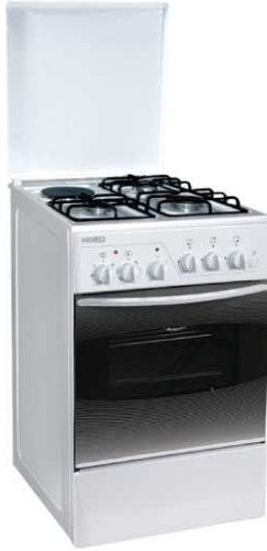
Модель на фото: ПГЭ-510.03