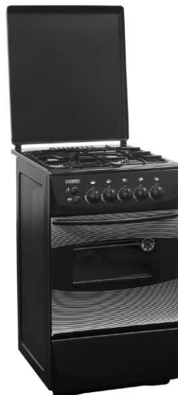
Цвет: черный Модель на фото: ПГ4 103-4А