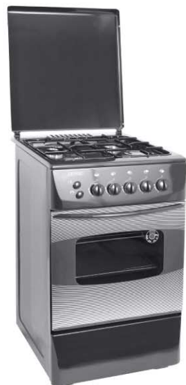
Цвет: серый Модель на фото: ПГ4 103-4А