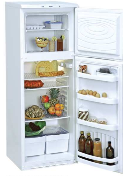
Модель на фото: ДХ-212-010