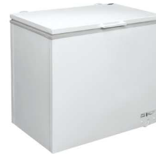
Модель на фото: INTER-200