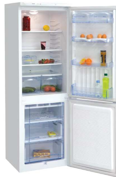
Модель на фото: ДХ-239-7-020