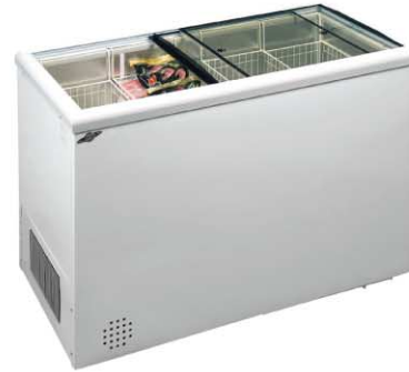
Модель на фото: INTER-300-C