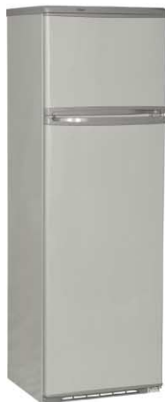
Цвет: серый Модель на фото: ДХ-244-110