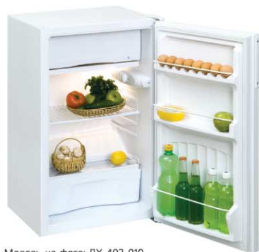
Модель на фото: ДХ-403-010