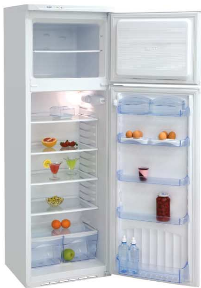
Модель на фото: DX-244-6-020