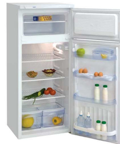
Модель на фото: ДХ-271-080