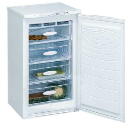
Модель на фото: ДМ-161-010