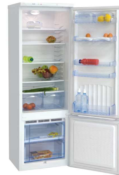
Модель на фото: ДХ-218-7-020