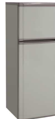
Цвет: серый Модель на фото: ДХ-274-180