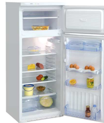
Модель на фото: DX-241-6-020