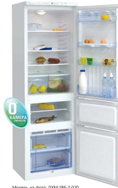
Модель на фото: ДХМ-186-7-020