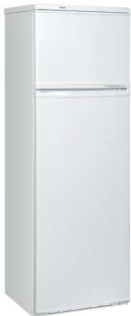
Цвет: белый Модель на фото: ДХ-244-010