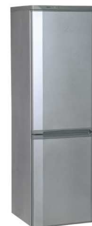
Цвет: металл Модель на фото: ДХ-239-7-320