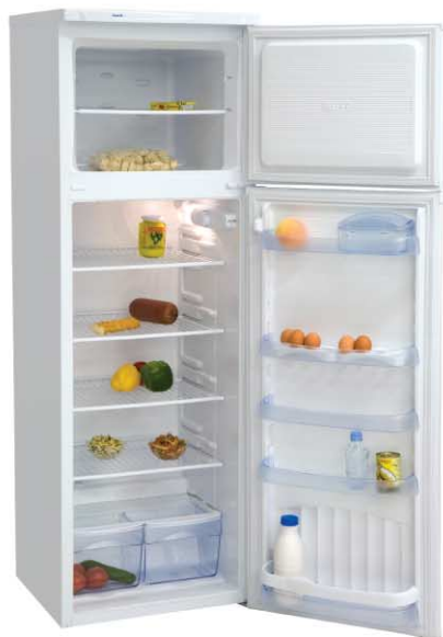
Модель на фото: ДХ-274-080