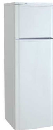
Цвет: белый Модель на фото: ДХ-274-080