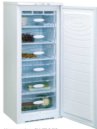
Модель на фото: ДМ-155-3-010