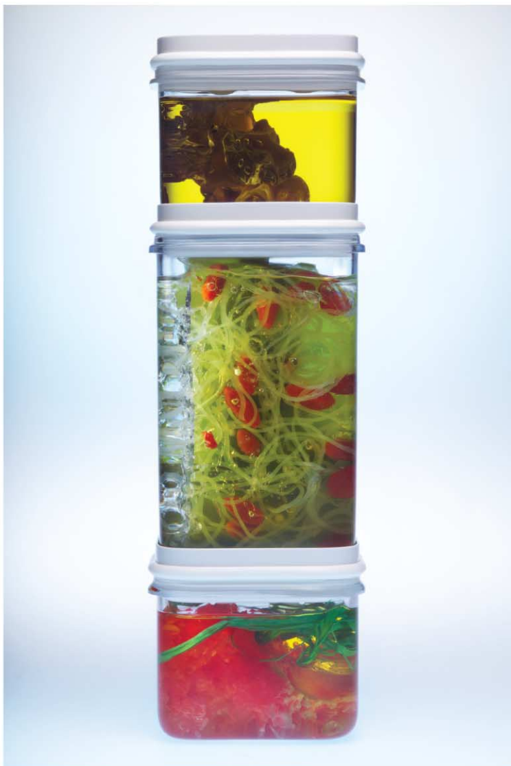
ВРЕМЯ ПРОХОДИТ. NORD ОСТАЕТСЯ.