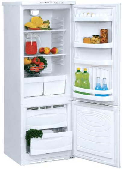
Модель на фото: ДХ-221-7-010