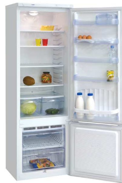
Модель на фото: ДХ-218-7-080