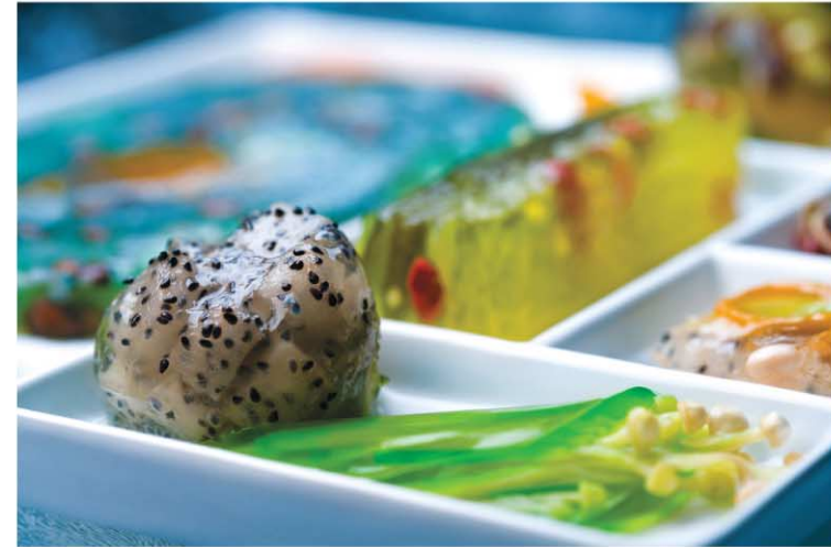
ВРЕМЯ ПРОХОДИТ. NORD ОСТАЕТСЯ.

Серия COMFORT — для практичных людей, выбирающих стильный, комфортный и экономичный холодильник.