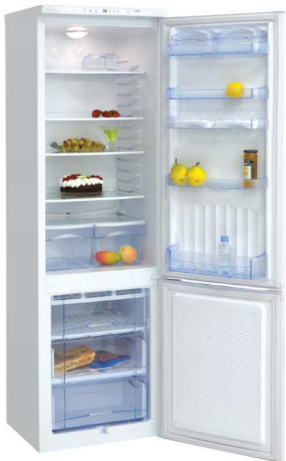
Модель на фото: ДХ-220-7-020