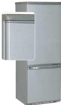
Цвет: шагрень-серебро Модель на фото: ДХ-221-7-410