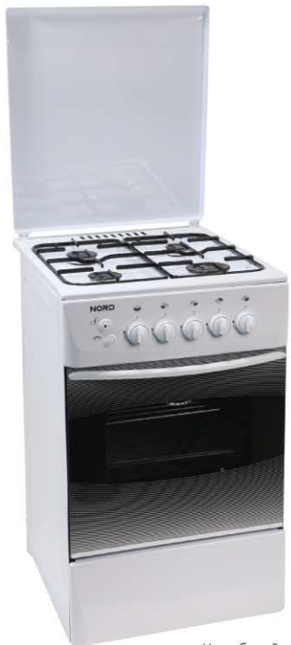
Цвет: белый Модель на фото: ПГ4 103-4А