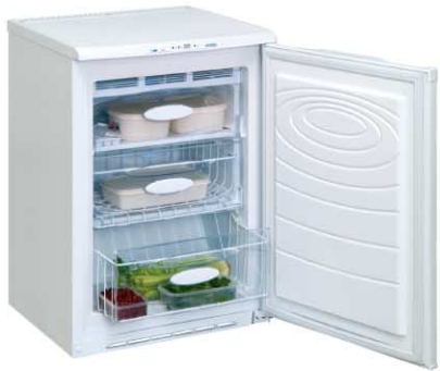
Модель на фото: ДМ-156-010