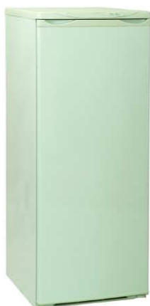
Цвет: салат Модель на фото: ДХ-416-7-610