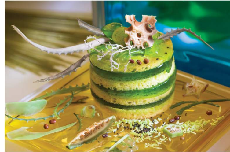
ВРЕМЯ ПРОХОДИТ. NORD ОСТАЕТСЯ.

Серия STANDARD – для тех, кто предпочитает холодильники классического дизайна. Разнообразие холодильников и морозильников NORD для любителей качественных и экономичных моделей.