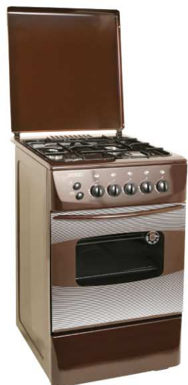
Цвет: коричневый Модель на фото: ПГ4 103-4А

Мир меняется с каждым днем. Привычные вещи изменяются, но неизменным остается потребность в качестве, практичности и долговечности.