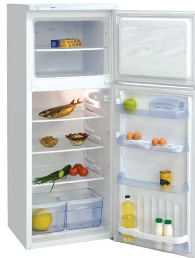
Модель на фото: ДХ-275-080