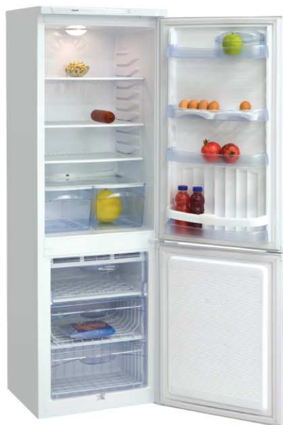
Модель на фото: ДХ-239-7-080