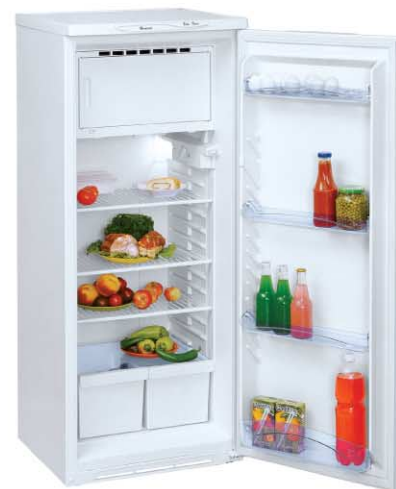
Модель на фото: ДХ-416-7-010