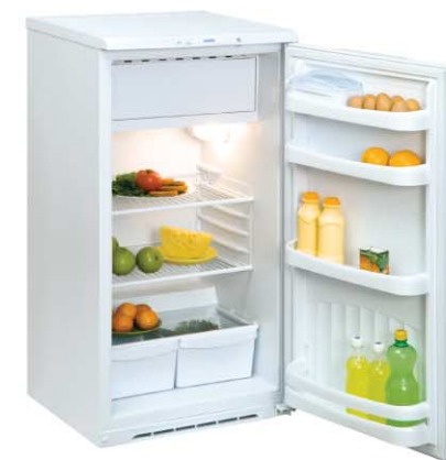
Модель на фото: ДХ-431-7-010