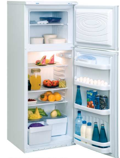
Модель на фото: ДХ-245-010