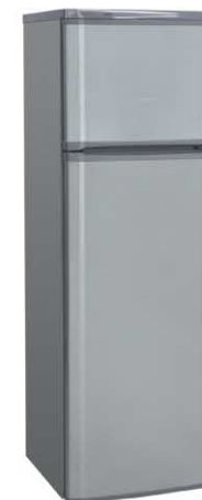
Цвет: металл Модель на фото: ДХ-274-380