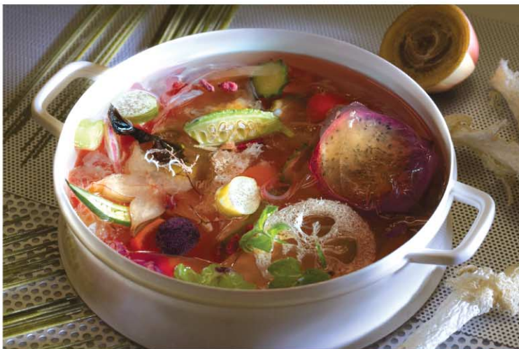
ВРЕМЯ ПРОХОДИТ. NORD ОСТАЕТСЯ.

Для изготовления холодильников "NORD" используются современные высококачественные материалы, которые закупаются у лучших зарубежных производителей – "BASF", "HUNTSMAN" и "HALTERMANN".