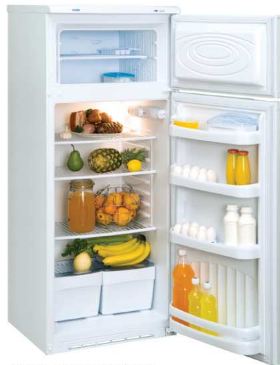
Модель на фото: ДХ-241-010