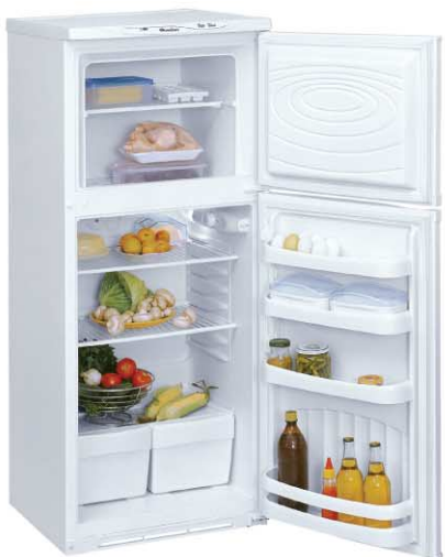
Модель на фото: ДХ-243-010