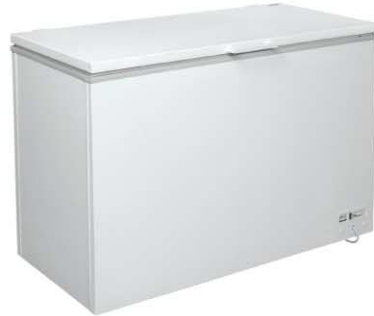
Модель на фото: INTER-300