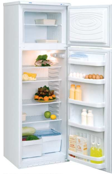
Модель на фото: ДХ-244-010