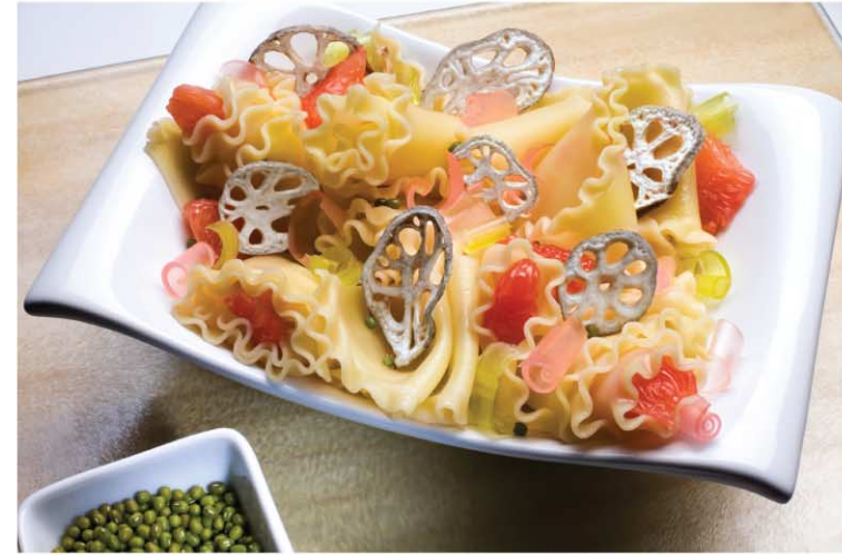
ВРЕМЯ ПРОХОДИТ. NORD ОСТАЕТСЯ.

Серия FORWARD – удачное сочетание современного дизайна, экономичности и высокой функциональности. В холодильниках серии FORWARD воплощено все лучшее из накопленного опыта в области производства бытовых приборов.