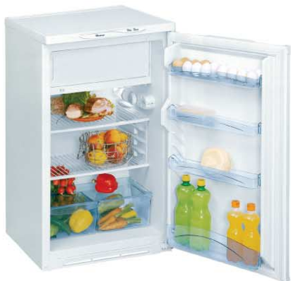
Модель на фото: ДХ-442-7-010