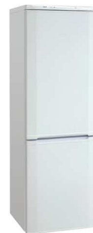
Цвет: белый Модель на фото: ДХ-239-7-020