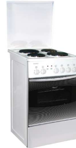
Модель на фото: ЭП 4.00