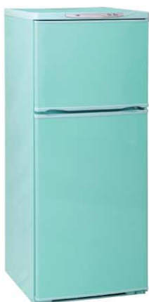
Цвет: бирюза Модель на фото: ДХ-243-610