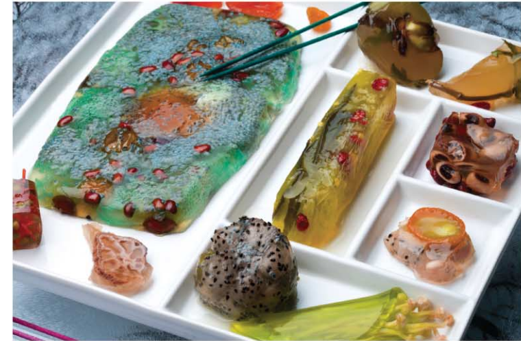
ВРЕМЯ ПРОХОДИТ. NORD ОСТАЕТСЯ.