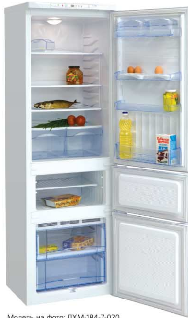
Модель на фото: ДХМ-184-7-020