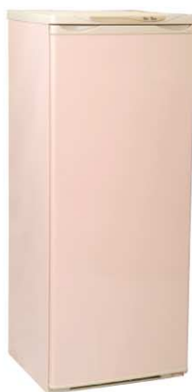
Цвет: бежевый Модель на фото: ДХ-416-7-710