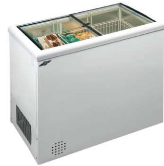
Модель на фото: INTER-200-C