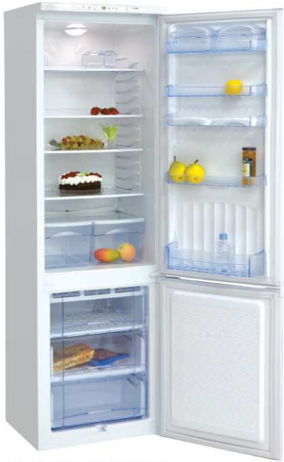
Модель на фото: ДХМ-183-7-020