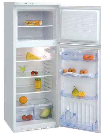
Модель на фото: DX-245-6-020