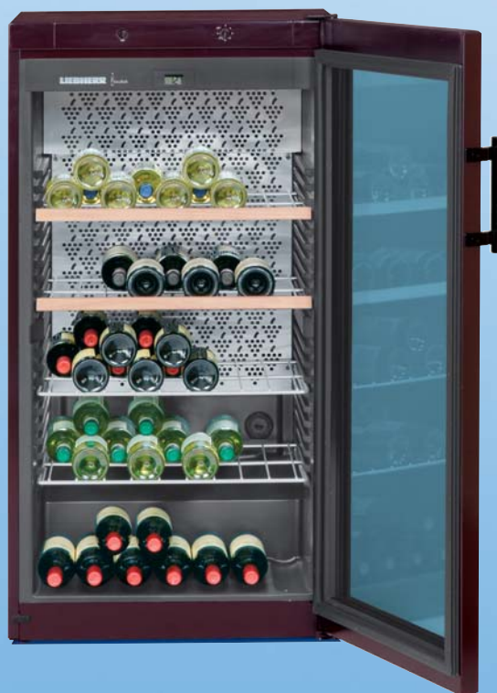
WK 2927 Vinothek